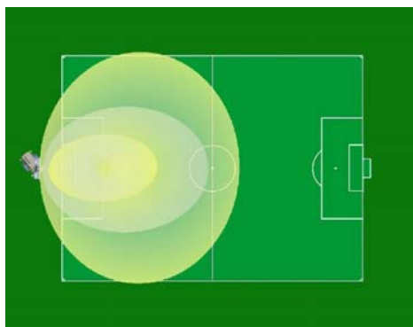
FT8 4x1000 JM Moyenne/Average LUX level = 20 LUX Sur/On 3800 mq area